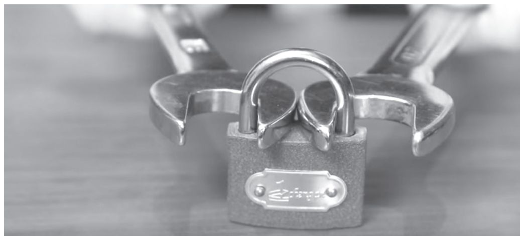
Just another way to break a padlock.

tion, like superglueing the keyhole of locks or cutting high-voltage compressor cables with bolt cutters (it makes for a decent explosion that one...!).