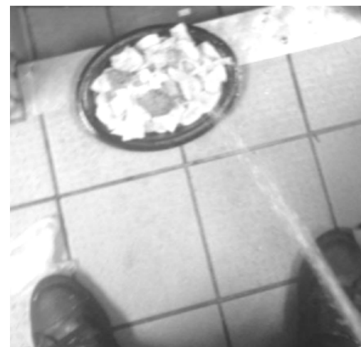
Piss with your dish, sir?

Om hvis vi så er taknemmelige for disse ting? Ja, så er vi i hvert fald ikke i tvivl