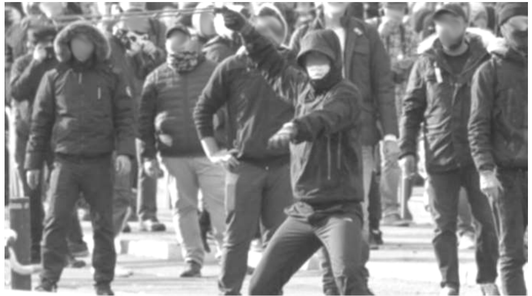
Flere personer blev dømt for at bruge en slynge til at kaste sten efter politiet i Göteborg d. 30. september. Anklageren anså at brugen af en slynge kan sammenlignes med at bruge bue og pil.

Efter den 30. september beskrev mange dagen således at nazisterne blev standset, men vi ser bare en gentagelse af det som skete i forbindelse med Svenskarnas parti i Limhamn og Kungsträdgården. Nazisterne får lov at gennemføre deres demonstrationer, beskyttede af pansere og samfundet, mens individer som handler imod dem bliver udsat for vold, arrestationer, husransagninger, retsprocesser og straffe. Endnu engang ventes sagsomkost-