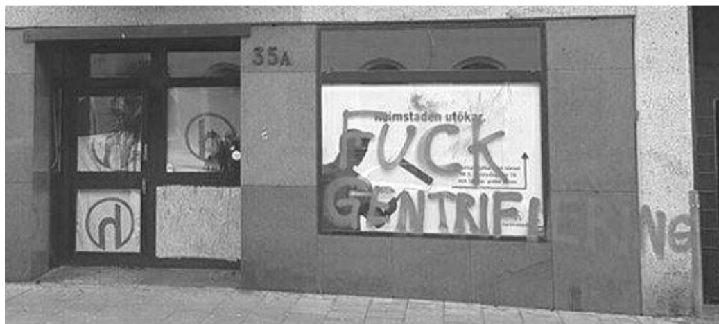
Malingbomber og graffiti mod gentrificering i Malmö, Sverige.

Byfornyelse. Følgende tekst offentliggjordes den 21. december på den svenske revolutionære hjemmeside gatorna.info . Den beskriver gentrificeringen af Malmö, og noget hærværk som udførtes mod to af de største ejendomsselskaber som driver byfornyelsen. Vi ved at der også her i København er kammerater som diskuterer fænomenet og hvordan man skal bekæmpe de riges overtagelse af vore kvarterer. Tekstens forfattere opfordrer til en mangesidet kamp, som tager forskellige midler i brug. I solidaritet med de som ikke kun snakker, men også handler, og for at give endnu et indskud til de igangværende diskussioner, offentliggør vi her hele teksten i oversættelse. Se kommentar på bagsiden.