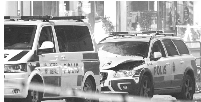
Sprængt svinetransport i Malmø, Sverige.

29. december. En tom politibil parkeret foran en politistation i Malmø blev fredag aften ca. kl. halv otte udsat for en eksplosion. Bilen blev voldsomt skadet. Kort tid efter anholdt politiet to personer i nærheden, og anklagede dem for at være ansvarlige for sprængningen. Den ene