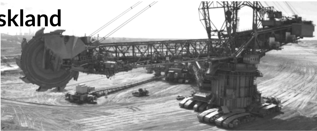
Den gigantiske maskine som æder Hambachskoven. Ved larvefoden til venstre skimtes en bil.

I protest mod energigiganten RWE, Europas andenstørste CO₂-udleder, og deres destruktive arbejde (både lokalt gennem minearbejdet og fældningen af skoven, og globalt gennem udledning af drivhusgasser og global opvarmning), har aktivister fra hele Europa, med protestlejren skabt et samlingspunkt for den antiautoritære, antikapitalistiske og direkte-aktions-baserede klimabevægelse. Her har aktivister delt deres evner og viden, organiseret en varieret og effektiv kampagne imod det tyske energifirma, og i fællesskab opretholdt, trods flere rydninger og politiaktioner, en autonom