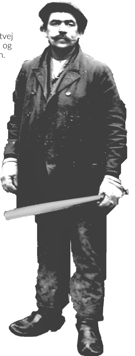
Hylsteddemonstrationen afholdes den 11. februar kl. 13.00 fra Jagtvej 69.