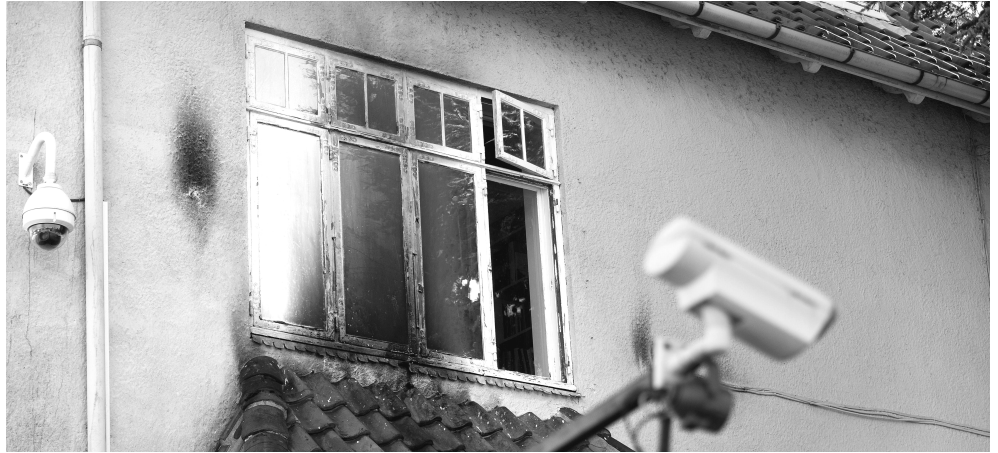
Den tyrkiske ambassade blev mandag den 19. marts angrebet med molotovcocktails.

» Ved at lukke ned for informationen lykkes politiet med at skabe stilhed omkring sagen, en stilhed som næres af den frygt for repression og overvågning som gennemsyrrer dette samfund. Det er livsvigtigt for alle revolutionære at bryde denne tavshed, med ord og handlinger.