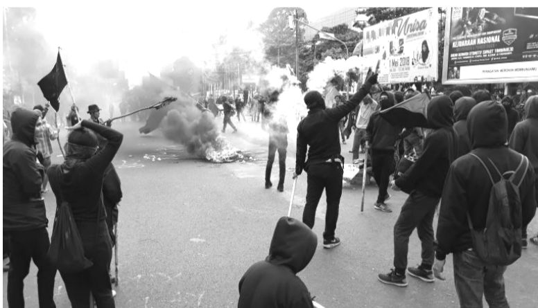
Anarkister sætter gaden i brand i Yogyakarta den 1. maj 2018.

NYIA, lufthavnen som demonstrationen bl.a. vendte sig imod, er et kontroversielt projekt som mødes med stor modstand af bønderne som tvangsforflyttes i forbindelse med byggeriet. De selvsamme bønder lykkedes for få år siden at bekæmpe udviklingen af jernminer i området. Mineprojektet mødtes med voldsomme demonstrationer, og ligger nu i dvale. Anarkister deltog i kampen, og har jævnlige informeret om den, også på eng-