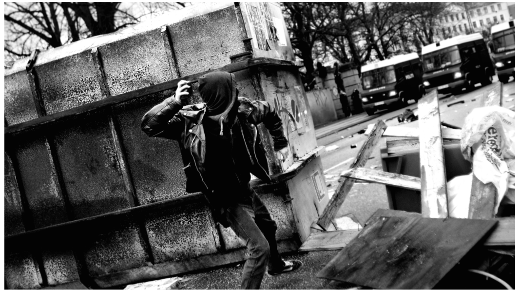
Er oprør pubertært?

Meningsløsheden og afstumpetheden er i høj grad et ideologisk spørgsmål. Magthaverne ser f.eks. meningsløshed i ødelæggelse, frigørelse og vold der bryder med det statslige monopol, imens at oprørske individer ser meningsløshed i undertrykkelse, forurening og ensformighed. Ligeledes er det i sig selv afstumpet at være oprører, fordi det er 'udenfor rammerne', imens det i sig selv er afstumpet at være ordensmagt, fordi den 'skaber